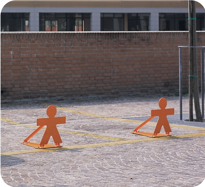
Design: Arch. Federica Fulci